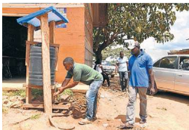
Un home rentant-se les mans en un dels molts bidons d'aigua amb clor de la població de Beni. M.B.

Beni té una població de més de 700.000 habitants, però no hi ha aigua corrent ni electricitat en tot el terme municipal. Els veïns obtenen l'aigua de dipòsits comunitaris, i qui té llum durant algunes hores del dia és perquè fa servir un generador o panells solars. La localitat, que està formada bàsicament per cases d'una sola planta, només té 14 quilòmetres de carrers pavimentats. La resta són de terra. Moure-s'hi és un maldecap, però per a l'Ebola s'ha convertit en un terreny adobat. ■