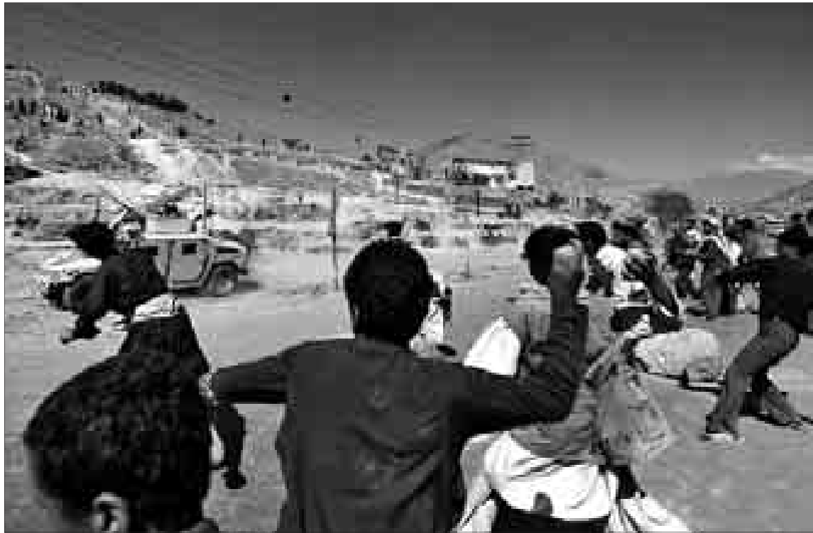
Manifestantes afganos arrojan piedras contra un vehículo militar norteamericano, ayer en Kabul.

Cinco personas mueren en los enfrentamientos, durante los que se asaltaron diversas ONG y empresas internacionales